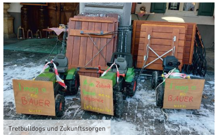
Tretbulldogs und Zukunftssorgen