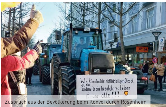
Zuspruch aus der Bevölkerung beim Konvoi durch Rosenheim