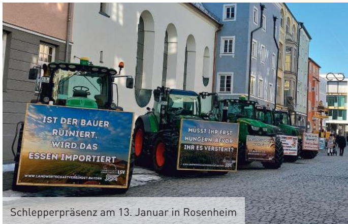
Schlepperpräsenz am 13. Januar in Rosenheim